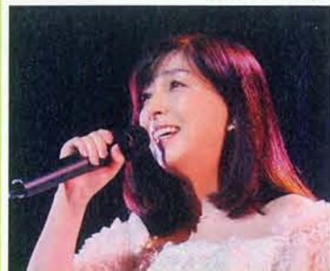
takako okamura シンガーソングライター 岡村 孝子 さん

岡村孝子さんと森田正光 さんの子育て体験手記。 みなさんの問題解決の きっかけに!