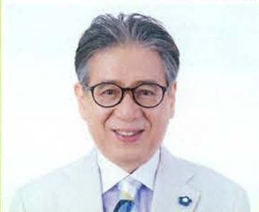
masamitsu morita 気象予報士 森田 正光 さん

岡村孝子さんと森田正光 さんの子育て体験手記。 みなさんの問題解決の きっかけに!